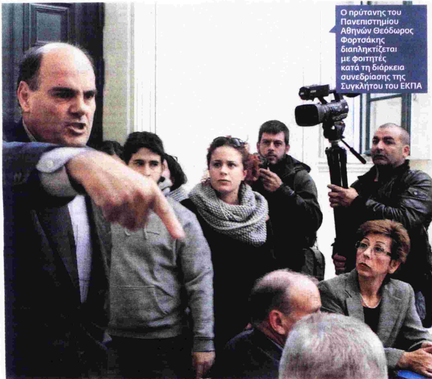
Ο πρύτανης του Πανεπιστημίου Αθηνών Θεόδωρος Φορτσάκης διαπληκτίζεται με φοιτητές κατά τη διάρκεια συνεδρίασης της Συγκλήτου του ΕΚΠΑ

«Τα παραπάνω πάντως καθιστούν επίκαιρο το πάγιο πρόβλημα προσδιορισμού του αριθμού των εισαγομένων σε κάθε Σχολή. Είναι προφανές ότι δεν είναι δυνατόν να προκύπτει με... εποχικά πολιτικά κριτήρια αλλά με συγκεκριμένο αλγόριθμο, που θα συμφωνηθεί μεταξύ της Πολιτείας και του κάθε Ιδρύματος και θα καθορίζει ετησίως τον συνολικό αριθμό εισαγομένων με βάση την υπάρχουσα υλικοτεχνική υποδομή, το διαθέσιμο έμψυχο υλικό και βέβαια την εξασφαλιζόμενη ετήσια δημόσια χρηματοδότηση. Αυτή φαίνεται να είναι η μόνη διέξοδος στο διαχρονικό αδιέξοδο του συνεχώς αυξανόμενου αριθμού εισαγομένων» επισημαίνει ο πρύτανης του ΕΜΠ.