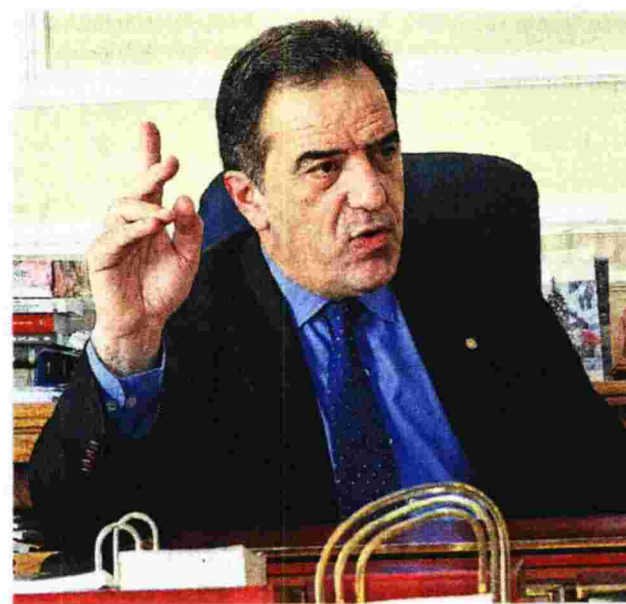
Ο πρύτανης του Οικονομικού Πανεπιστημίου Αθηνών Κωνσταντίνος Γάτσιος

■ Κάποιοι σχολίασαν στα περί ηλεκτρονικών ψηφοφοριών από τους φοιτητές για θέματα όπως οι καταλήψεις ότι κάτι τέτοιο οδηγεί στην απαξίωση των φοιτητικών συλλόγων. Ποια είναι η άποψή σας;